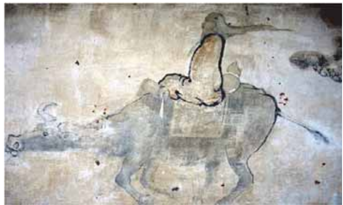
Wandgemälde im Wūdāngshān 武當山, Foto: E. Friedrichs

Überlegungen und Erfahrungen in Verbindung mit dem Dao'de'jing [Tao Te king] des Laozi [Lao Tse]